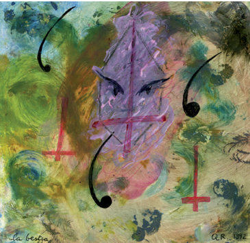
La bestia, 1992

7 Francisco Rivas, Reivindicación de Don Pedro Luis de Gálvez a través de sus úlceras, sables y sonetos , Editorial Zut, Sevilla, 2014.