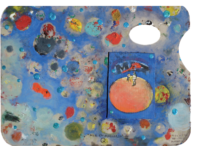
Mir en Mallorca, 1991-2001

Mantiene una continuada relación con la galería Buades y con los pintores que allí exponen, como los de la llamada Nueva figuración madrileña, el grupo Trama y otros, así como con muchos protagonistas de La movida, sobre quienes escribe numerosos textos para catálogos o algunas letras para canciones. Comisaría exposiciones representativas de una época: 1980 -un alegato a favor de la pintura- , Su disco favorito -testimonio de su implicación con el mundo de la música-, Madrid, Madrid, Madrid -un intento de exponer la recuperación de Madrid como centro cultural entre 1974 y 1984, y Madrid-Vigo -un encuentro cultural de ambas ciudades.