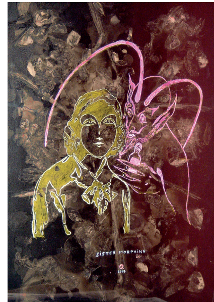
Sister Morphine , 2007