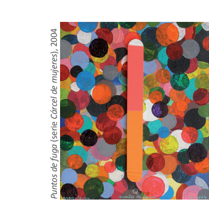
Puntos de fuga (serie Cárcel de mujeres), 2004

Rivas no se esconde tras sus dibujos, muy al contrario, se “expone” (valga la redundancia)