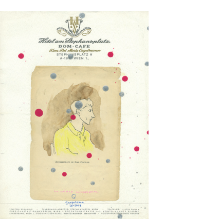
Un héroe confederal, 2004

En 1998, su casa de Los Molinos en la Sierra de Madrid se incendia y gran parte de su pinacoteca, biblioteca, cientos de carpetas con